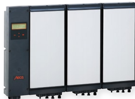
StecaGrid 2000+ master en 2 StecaGrid 2000+ slaves