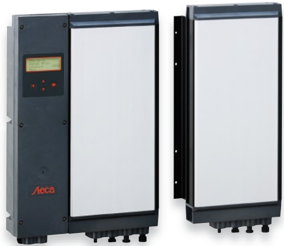
StecaGrid 2000+ master